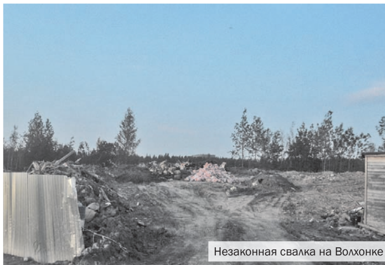
Незаконная свалка на Волхонке