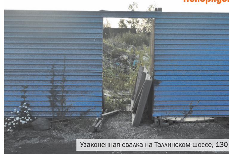
Узаконенная свалка на Таллинском шоссе, 130

Надо сказать, что наш район уже давно страдает от подобных дельцов, ведь здесь всегда можно найти потаённые уголки для размещения отходов. Причём нередко с лёгкой руки недобросовестных чиновни-